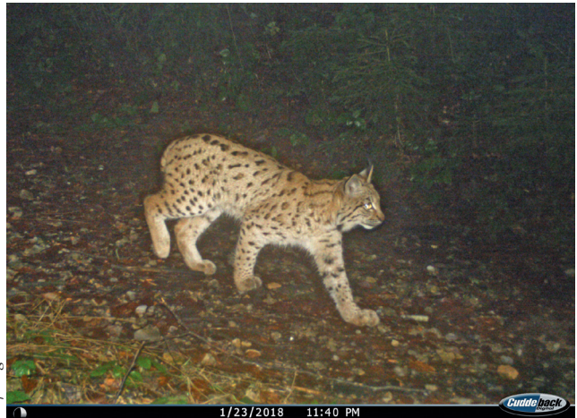
Abb. 1: Aufnahme aus dem Fotofallen-Monitoring. Luchse haben ein individuelles Fellmuster, das erlaubt, Individuen voneinander zu unterscheiden.

Im Sachbereich Luchs war KORA zuständig für Fang, Quarantäne, Betreuung, Freisetzung und Monitoring. Bereits zuvor hatte KORA eine bedeutende Vorarbeit geleistet, die in einer multivariaten Habitatanalyse von 1999 in der Nordostschweiz rund 1'000 km 2 Lebensraum als für den Luchs geeignet qualifizierte.