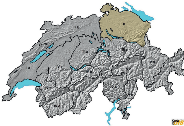
Abb. 2: Teilkompartimente für das Grossraubtiermanagement in der Schweiz. Das Kompartiment II Nordostschweiz ist gelb markiert.

markierten Tiere mittels Kreuzpeilung. Ab 2005 wurden erste GPS-GSM-Halsbänder verwendet. Zufallsbeobachtungen wurden vom KORA-Team nach den international geltenden SCALP (Status and Conservation of the Alpine Lynx Population)-Kriterien kategorisiert. Bereits während der Projektdauer kam die Fang-Wiederfang-Schätzung der Luchspopulation mittels Fotofallen zum Einsatz, eine Methode, die nach Abschluss des Projekts 2009 noch dreimal angewendet wurde, letztmals im Winter 2017/2018 und die mittlerweile zum Standard geworden ist.