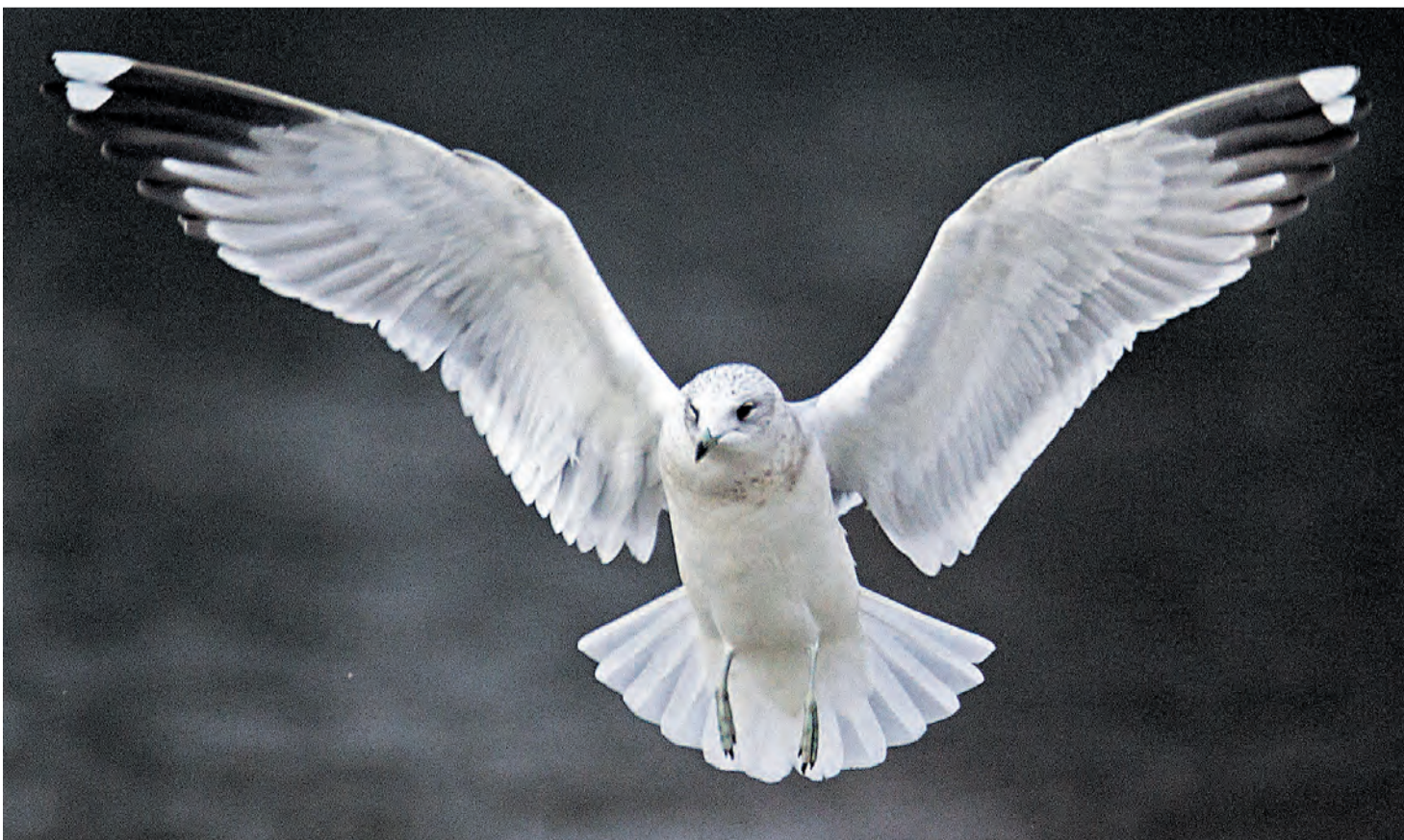
Kurz vor der Landung spreizt diese aus Nordeuropa angereiste Sturmmöwe ihre Flügel.