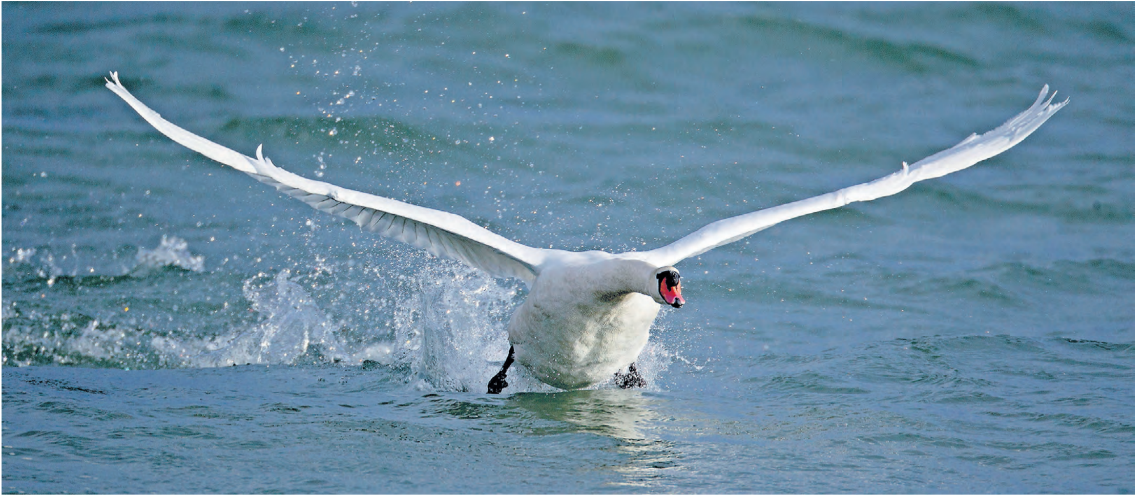
Bereits beginnen Höckerschwäne, ihre Territorien abzustecken, und attackieren konkurrierende Artgenossen (Schmerikon).