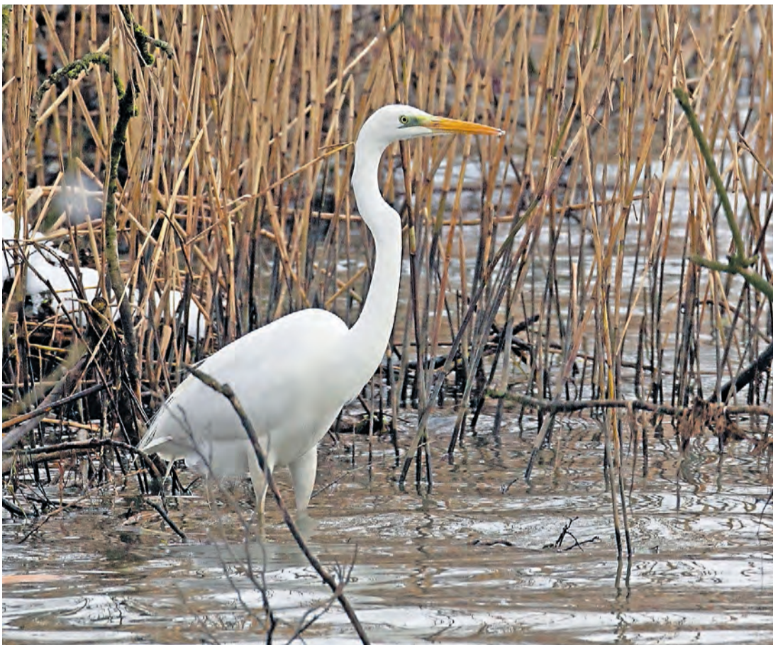
Ein Silberreiher sucht im schilfbewachsenen Ufersaum nach Nahrung.

TIERWELT Der Uzner Wildtierökologe und Fotograf Klaus Robin ist für die ZSZ mit seiner Kamera den Uferpromenaden des Zürichsees und den Linthdämmen entlangspaziert.